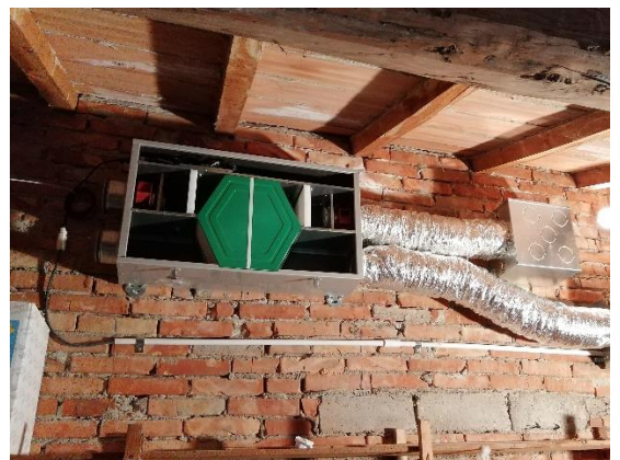
Foto di cantiere