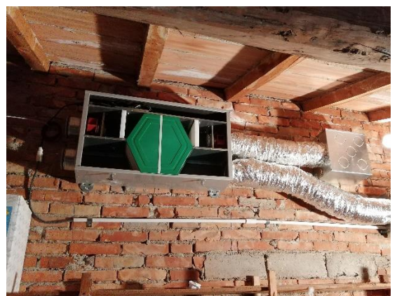
Foto di cantiere